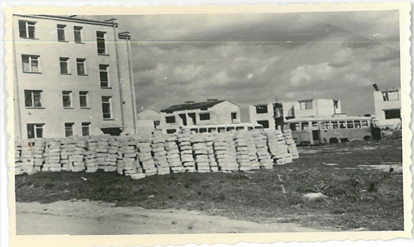
Zespół archiwalny: Prezydium Miejskiej Rady Narodowej w Radzynie Podlaskim, sygn. 220, s. 106, zdj. Nr 16: Baza PKS w Radzynie na tle domów jednorodzinnych (ul. Tysiąclecia) z widocznym budynkiem administracyjnym Oddziału PKS (dzisiejsza ul. Powstania Styczniowego), 1966 rok.