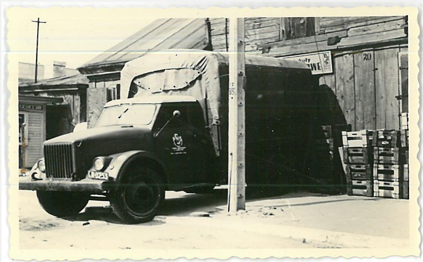
Zespół archiwalny: Prezydium Miejskiej Rady Narodowej w Radzynie Podlaskim, sygn. 220, s. 103., zdj. Nr 5: Rozładunek samochodu ciężarowego, który wjechał na chodnik z płyt cementowych, przy ulicy Warszawskiej nr 20, 1966 rok.