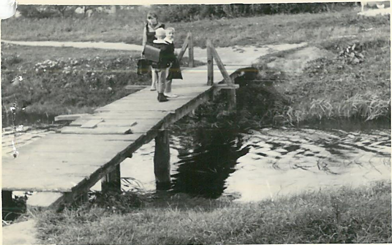
Zespół archiwalny. Prezydium Miejskiej Rady Narodowej w Radzynie Podlaskim, sygn. 220, s. 103, zdj. Nr 2: Most drewniany na rzece Białce na drodze do Szkoły Podstawowej Nr 2 w Radzynie, 1966 rok.