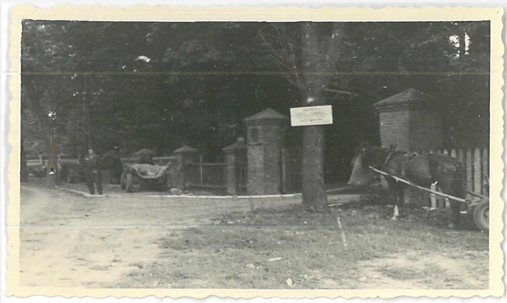
Zespół archiwalny: Prezydium Miejskiej Rady Narodowej w Radzynie Podlaski, sygn. 220, s. 103, zdj. Nr 4: Postój furmanek pod parkanem Szpitala Powiatowego przy PZZGS w Radzynie Podlaskim z widoczną tablicą „Uwaga ! Postój furmanek surowo wzbroniony”, 1966 rok.