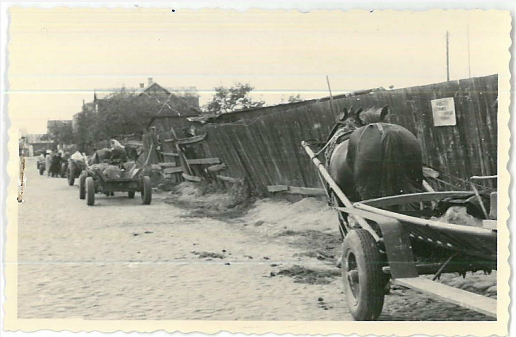
Zespół archiwalny: Prezydium Miejskiej Rady Narodowej w Radzynie Podlaskim, sygn. 220, s. 107, zdj. Nr 25: Postój furmanek przed magazynami Gminnej Spółdzielni Radzyń, przy ul. Dąbrowskiego, 1966 rok.