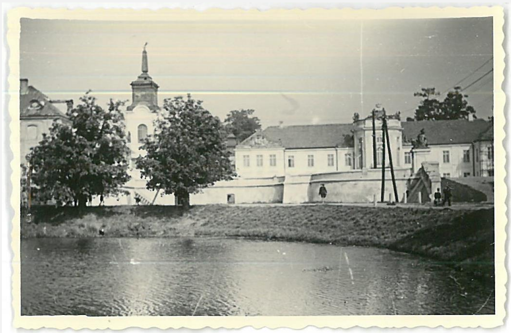
Zespół archiwalny. Prezydium Miejskiej Rady Narodowej w Radzynie Podlaskim, sygn. 220, s. 103, zdj. Nr 1: Pałac, siedziba PPRN w Radzynie, 1966 rok