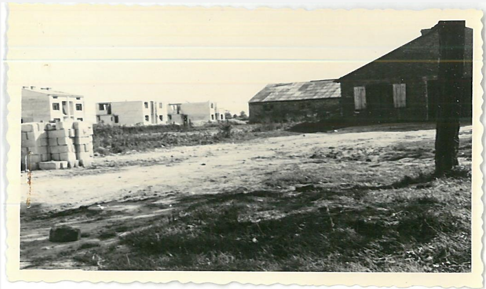
Zespół archiwalny: Prezydium Miejskiej Rady Narodowej w Radzynie Podlaskim, sygn. 220, s. 106, zdj. Nr 17: Kolonia domków jednorodzinnych (w budowie) obok garaży PKS i magazyn pasz mieszczący się w widocznym pomieszczeniu – dawnej oborze na folwarku Gubernia, 1966 rok.