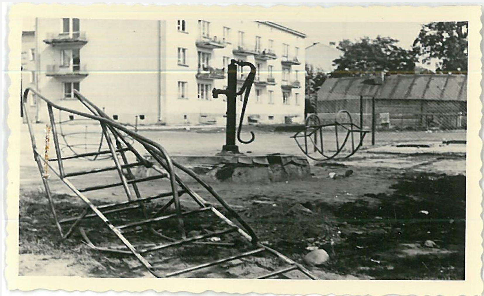
Zespół archiwalny: Prezydium Miejskiej Rady Narodowej w Radzynie Podlaskim, sygn. 220, s. 103, zdj. Nr 3: Ogródek jordanowski przy blokach mieszkalnych ZOR na ul. Warszawskiej, 1966 rok.