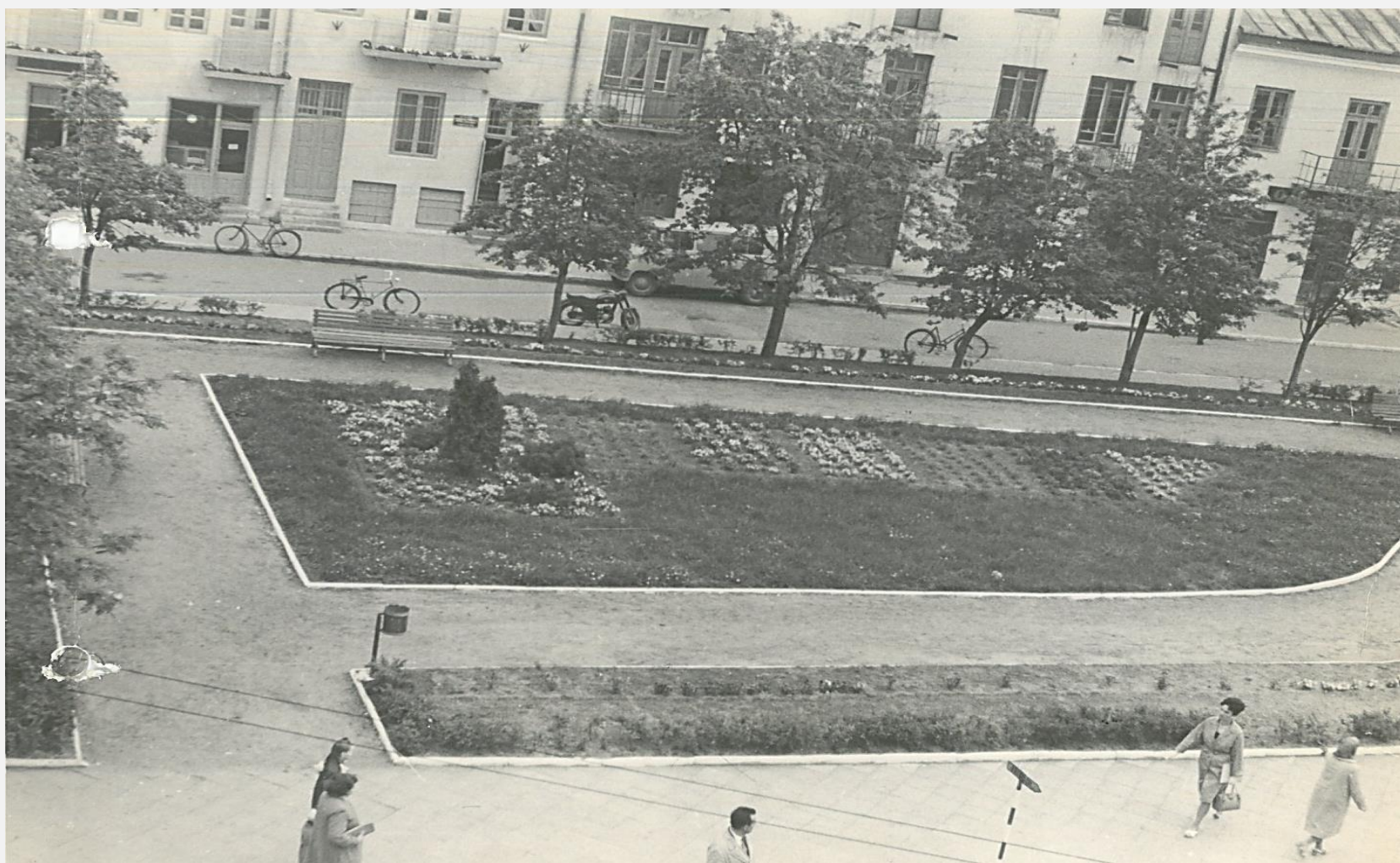
Plac Wolności przed wybudowaniem pomnika „Zwycięstwa”, 1969 rok.