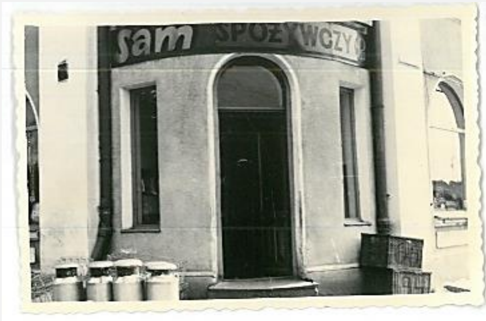
Zespół archiwalny: Prezydium Miejskiej Rady Narodowej w Radzynie Podlaskim, sygn. 220, s. 104, zdj. Nr 7: Sklep PSS w Radzynie Podlaskim, ul. Warszawska, 1966 rok.